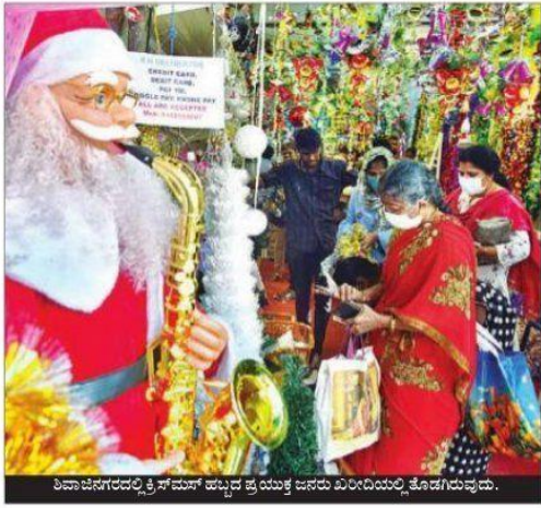
ಶಿವಾಜಿನಗರದಲ್ಲಿ ಕ್ರಿಸ್‌ಮಸ್ ಹಬ್ಬದ ಪ್ರಯುಕ್ತ ಜನರು ಖರೀದಿಯಲ್ಲಿ ತೊಡಗಿರುವುದು.