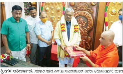
ಶ್ರೀಗಳ ಆರೋಪಣೆ. ಸರ್ಕಾರ ಸಚಿವ ಎಸ್.ಟಿ.ಸೋಮಶಂಕರ್ ಅವರು ಆರಂಭಿಸಿದಾಗ ದುರದ ಸೋತಾಡು ಕ್ಷಮದ ಡಾ. ಶ್ರೀ ನಿರ್ಮಲಾನಂದಾಚಾರ್ಯ ಸ್ವಾಮೀಶ ಅವರನ್ನು ಭೇಟಿ ಮಾಡಿ ಅರೋಪಣೆ ಮಾಡಿದರು.

ರಾತ್ರಿ 10 ಗಂಟೆಯಿಂದ ಬೆಳಿಗ್ಗೆ 6 ಗಂಟೆ ವರೆಗೆ ಮಾರ್ಗ ಸೂಚಿ ಸಂಜೆ ಚದುಗಡೆ ಬೆಂಗಳೂರು, ಡಿ.23 - ಹೊಸ ವಾಹನಿಯ ರೂಪಾಂತರಗೊಂಡ ಕೋವಿಡ್ ವ್ಯವಸ್ಥೆಗಳನ್ನು ಅಳವಡಿಸಿ ಸಂದರ್ಭದಲ್ಲಿ ಅಪಾಯ ಬಹುದಾದ ಛೇದನೆಯ ಕಾರಣಕ್ಕಾಗಿ ರಾಜ್ಯ ಸರ್ಕಾರ ಇಂದು ರಾತ್ರಿ ಯಿಂದಲೇ ಜಾರಿಯಲ್ಲಿರುವ ರಾಜ್ಯಾದ್ಯಂತ 9 ದಿನಗಳ ಕಾಲ ರಾತ್ರಿ ಕರ್ಫ್ಯೂ (ಕ್ಯೂರ್ಫ್ಯೂ) ವಿಧಿಸುವ ತೀರ್ಮಾನವನ್ನು ಕೈಗೊಂಡಿದೆ. ...ಪುಟ 2